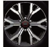
Jante aliaj 18" - Dyamond Cut - Premium D/C