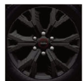
Jante aliaj 18" - Matt Dark Gray - Executive D/C