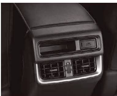
Rear A/C VENT