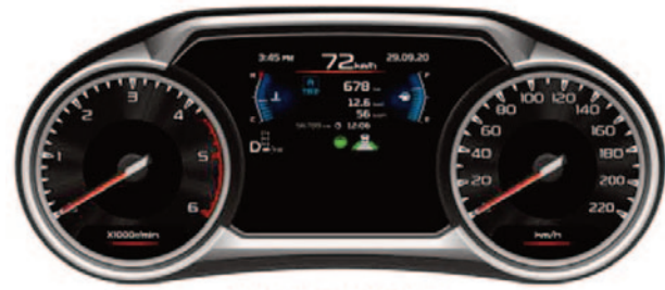
HI-GRADE METER ELECTRO LUMINESCENCE With 4.2" TFT LCD With SATAIN SILVER ORNAMENT