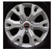
Jante aliaj 18" - Silver - Style D/C