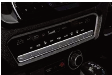
DUAL ZONE AUTO A/C