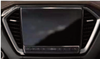
Infotainment 9 inch