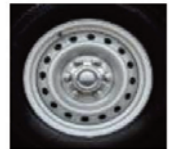
Jante oțel 16" - Basic S/C