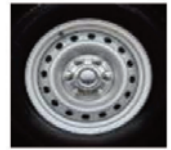
Jante oțel 18" - Classic D/C